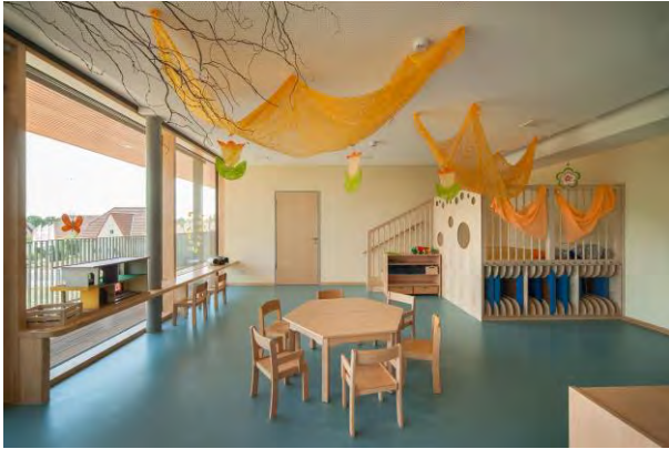
Gruppenraum im Obergeschoss