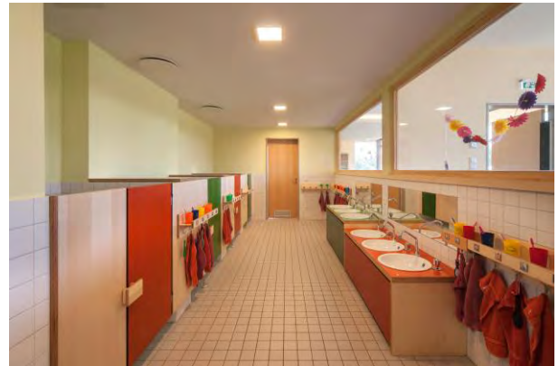
Sanitärbereich für die Kinder

Im Erdgeschoss befinden sich der Mehrzweckraum; Kinderrestaurant mit Küche und die beiden Räume der 22 Krippenkinder, Die Gruppenräume haben einen gemeinsamen Sanitärraum, die getrennten Schlafräume liegen seitlich. Im Obergeschoss sind auf der Südseite die 2 Gruppenräume für die 37 Kindergartenkinder, der gemeinsame Sanitärraum und die 2 Hortgruppenräume für 33 Schulkinder angeordnet.