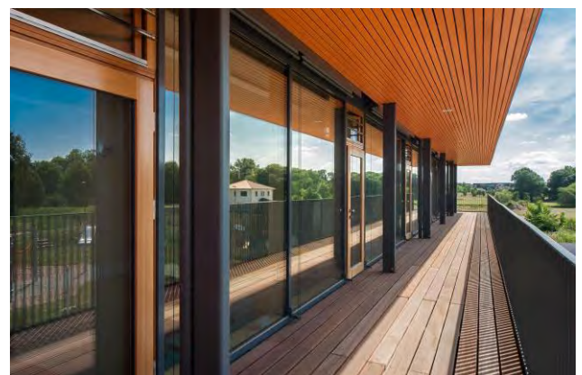
Balkon zum Spielen

Ein großer Balkon auf der Südseite vor den Gruppenräumen des 1.OG ermöglicht das Spielen und Frühstück der Kinder direkt im Freien.